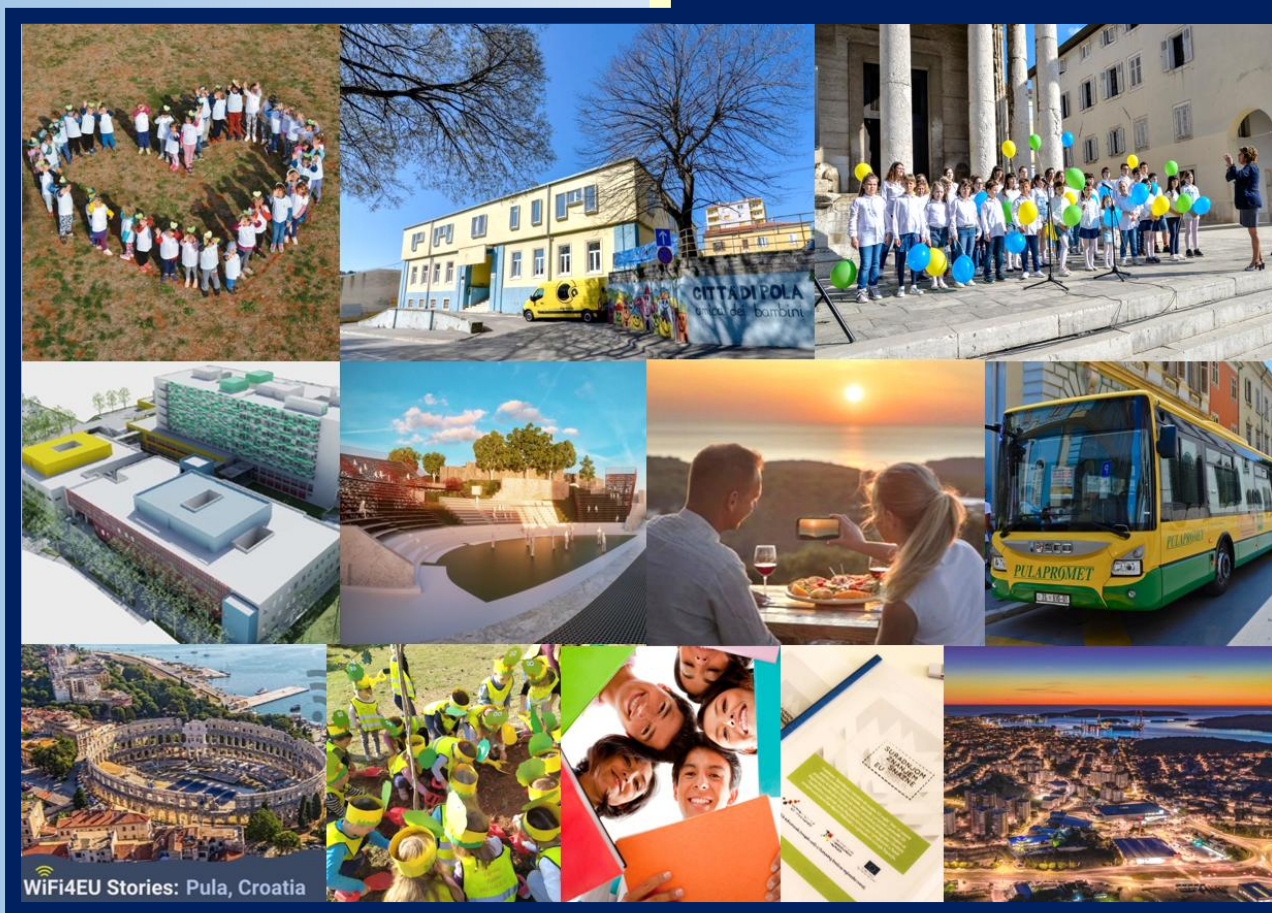
WiFi4EU Stories: Pula, Croatia

Euro Info Newsletter EDIC Pula-Pola namijenjen je građanima, gospodarstvenicima, udrugama civilnog društva, medijima, gradovima, općinama, županijama, javnim poduzećima, ustanovama i institucijama. Dakle svima onima koji mogu biti korisnici europskih sredstva, participirati na raznim natjecajima ili žele imati više informacija o europskim procesima.